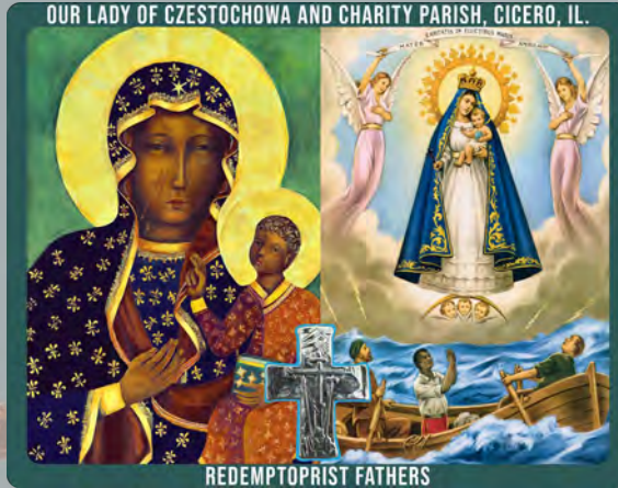
OUR LADY OF CZESTOCHOWA AND CHARITY PARISH, CICERO, IL.

Monday-Friday 9:00 AM to 5:00 PM Saturday-Sunday Closed