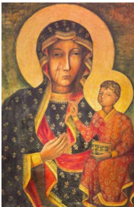
“La Madona Negra”

Al tercer Día se Celebró una boda en Caná de Galilea, y estaba Allí la madre de Jesús. Fue invitado también Jesús con sus Discípulos a la boda. Y como Faltó el vino, la madre de Jesús le dijo: --No tienen vino. Jesús le dijo: --¿Qué tiene que ver eso conmigo y contigo, mujer? Todavía no ha llegado mi hora. Su madre dijo a los que Servían: --Haced todo lo que él os diga. Había Allí seis tinajas de piedra para agua, de acuerdo con los ritos de los Judíos para la Purificación. En cada una de ellas Cabían dos o tres medidas. Jesús les dijo: --Llenad de agua las tinajas. Y las llenaron hasta el borde. Luego les dijo: --Sacad ahora y llevadlo al encargado del banquete. Se lo llevaron; y cuando el encargado del banquete Probó el agua ya hecha vino, y no Sabía de Dónde Venía (aunque los sirvientes que Habían sacado el agua Sí lo Sabían), Llamó al novio y le dijo: --Todo hombre sirve primero el buen vino; y cuando ya han tomado bastante, entonces saca el inferior. Pero Tú has guardado el buen vino hasta ahora. Este principio de señales hizo Jesús en Caná de Galilea, y Manifestó su gloria; y sus Discípulos creyeron en él.