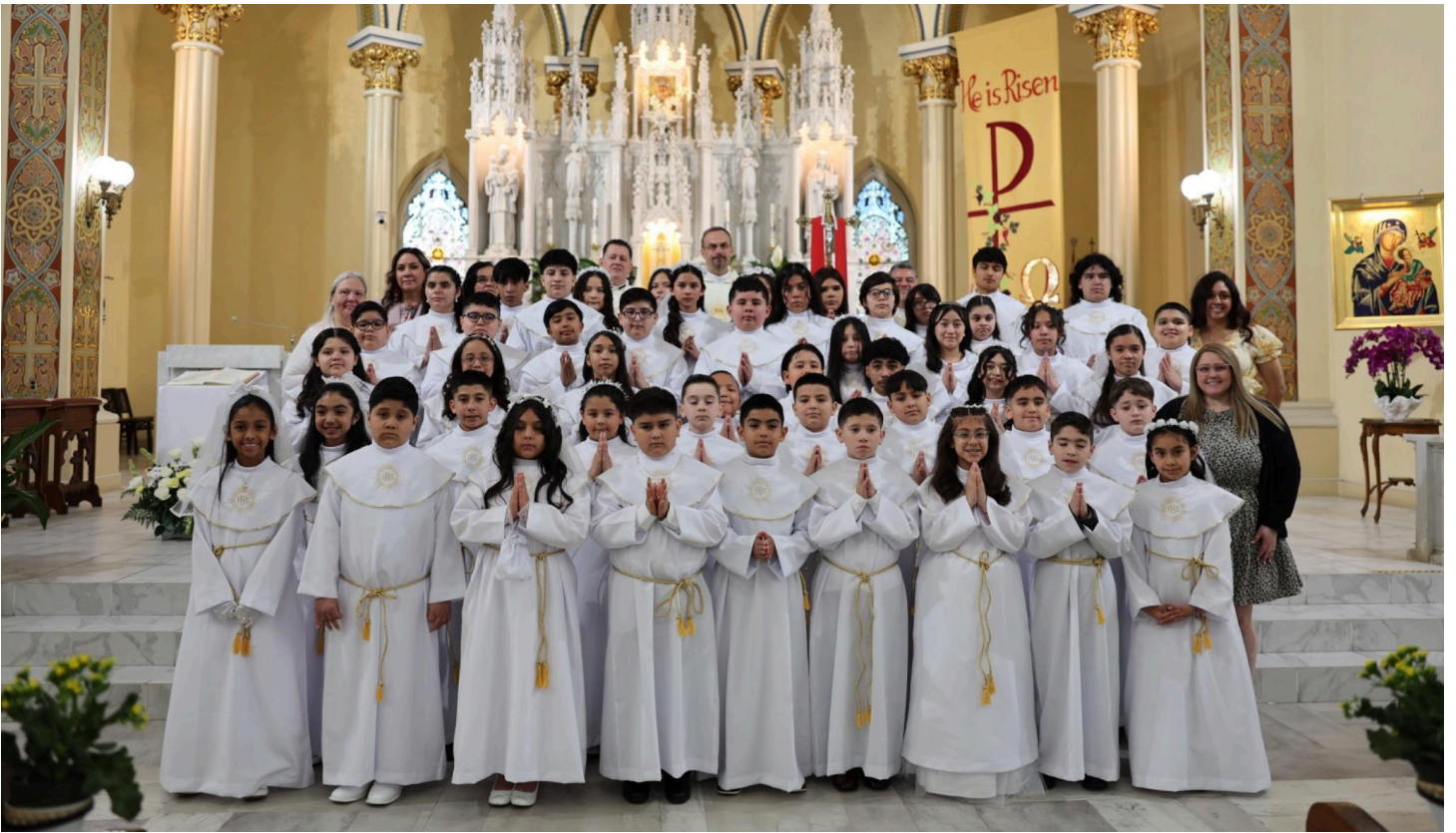
First Communion Class 2026 - CCD Program