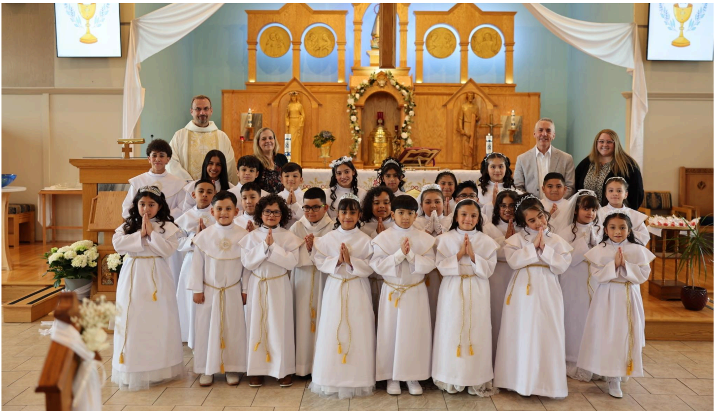
First Communion Class 2026 - School Program