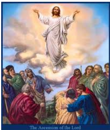
The Ascension of the Lord

celebrated 40 days after Easter commemorates Jesus bodily ascending into heaven to take his seat at the right hand of the Father. It marks the completion of his earthly mission and the inauguration of the Church's